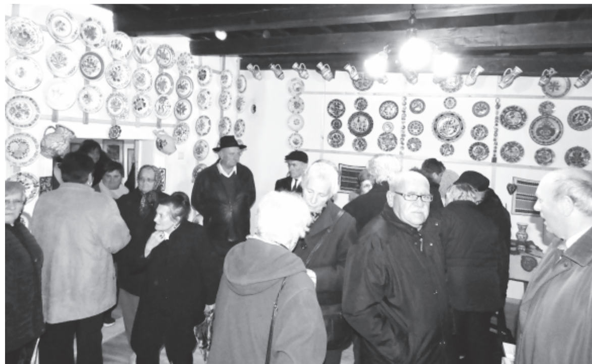
Sokan voltak kíváncsiak a gazdag gyűjteményre