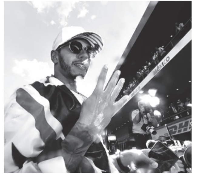
Négy! – mutatja az újdonsült világbajnok

A kétszeres világbajnok, McLarenes Fernando Alonso a mostani generáció bajnokának tartja Hamiltont. „Akkor is nyert futamokat, amikor jó autója volt, és akkor is, amikor nem volt olyan jó kocsija” – tette hozzá a spanyol pilóta.