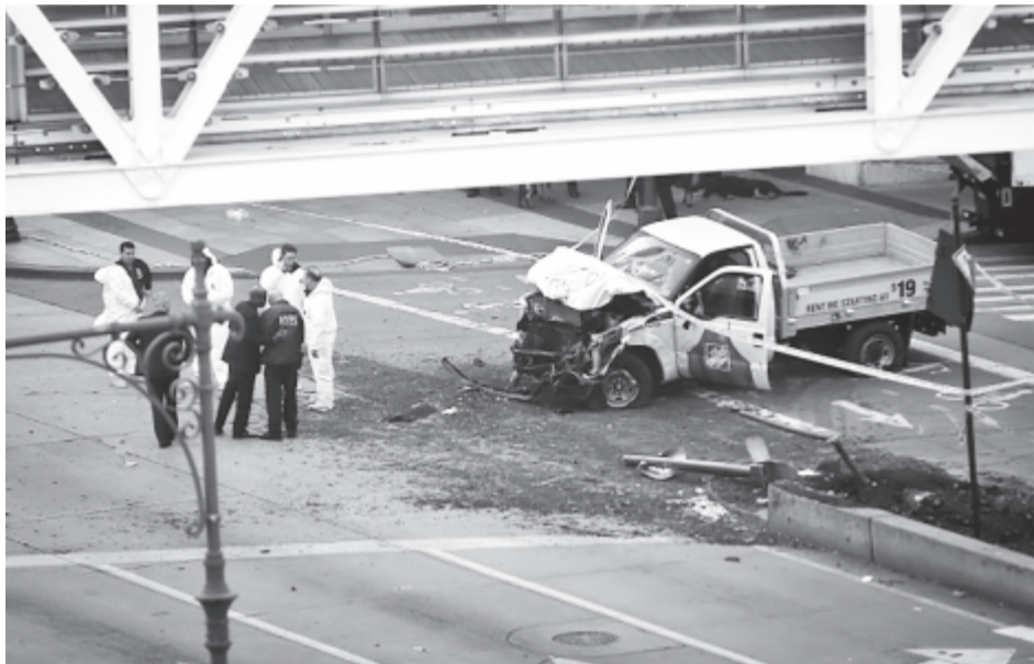
Dolgoznak a bűnügyi helyszínelők

A férfi egy ismerőse, akinél korábban lakott, a The Cincinnati Enquirer napilapnak elmondta, hogy a férfi mindig dolgozott. Nem járt társaságba, mindig hazament pihenni, majd ismét munkába ment. (MTI)