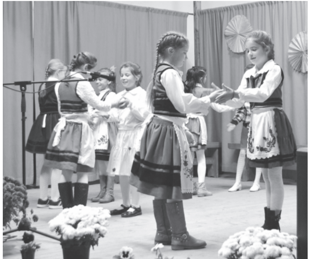
A helyi gyerekek is műsorral köszöntötték az idősebbeket